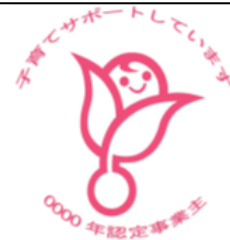
次世代認定マーク 「くるみん」

認定を受けた事業主は、次世代認定マーク(愛称：くるみん)を広告、商品、求人票等に表示し、子育てサポート企業であることをアピールすることができるほか、税制優遇制度の適用も受けられます。